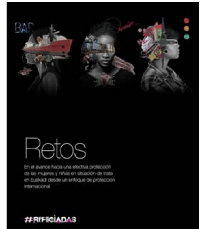
Portada del Informe de CEAR-Euskadi