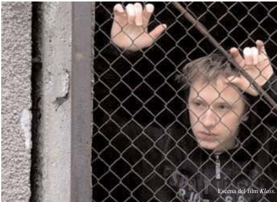
Escena del film Klass .

Hemos asistido a dos sesiones del filme con alumnos de secundaria, de 13 a 16 años, procedentes de colegios cercanos a Donostia. Eran sesiones en las que había más de 100 alumnos en la primera, los mayores, y unos 300 en la segunda con chicos y chicas más jovencitos.